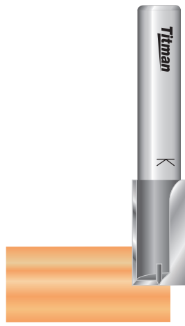
Falzen Rebating Feuillurer