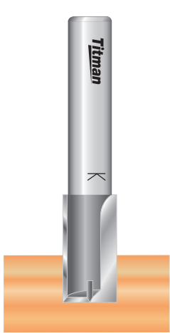
Nuten Grooving Rainure