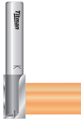
Formatieren Formating Formater